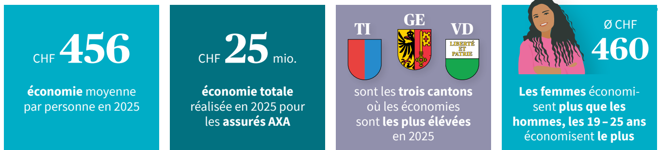
Économies moyennes (en CHF) par personne et par an (2025), par canton, tous types de changement confondus

Le rapport d'AXA sur le changement d'assurance de base fournit des informations sur les mouvements effectifs d'assurés dans l'assurance de base obligatoire selon la LAMal . Cette étude repose sur plus de 54 000 changements d'assurance de base effectués à l'automne 2024 par le biais du service de changement d'AXA et qui ont permis de réaliser des économies sur les primes 2025 .